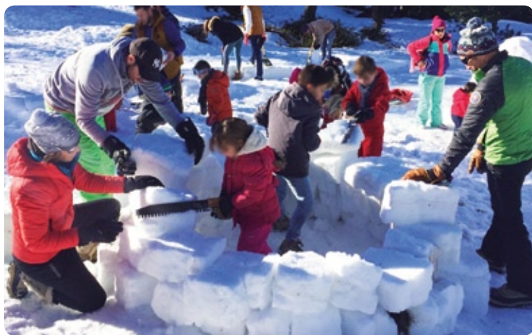
FÉVRIER Sortie neige sur le plateau de Beille avec tous les élèves de l'école

Moments choisis de l'année 2024 à Lempaut