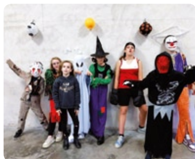
MAI Journée des CMJ du Tarn - Journée jeux de société OCTOBRE Boum d'Halloween