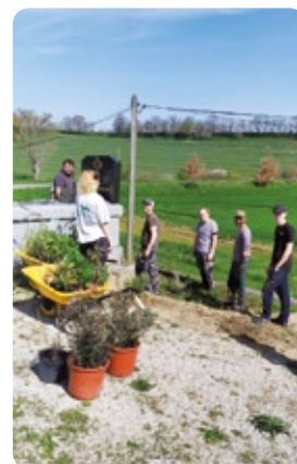
MARS Végétalisation de la piste cyclable et du cimetière par les élèves du lycée agricole et du CFPPA de Castelnaudary