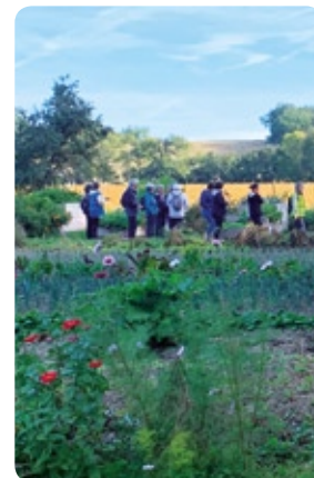
SEPTEMBRE Randonnée solidaire