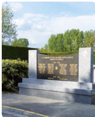
MAI Inauguration du nouveau monument aux morts