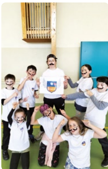
MAI Journée des CMJ du Tarn - Journée jeux de société