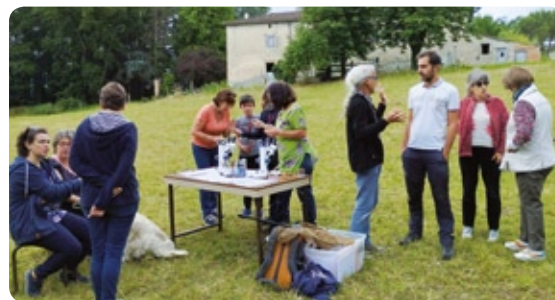
MAI-JUIN Les rendez-vous nature