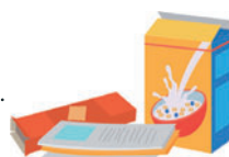
Papiers et cartons