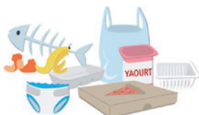
Les ordures doivent être obligatoirement déposées dans des sacs fermés.