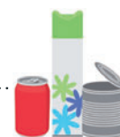
Boites métalliques, aérosols, canettes